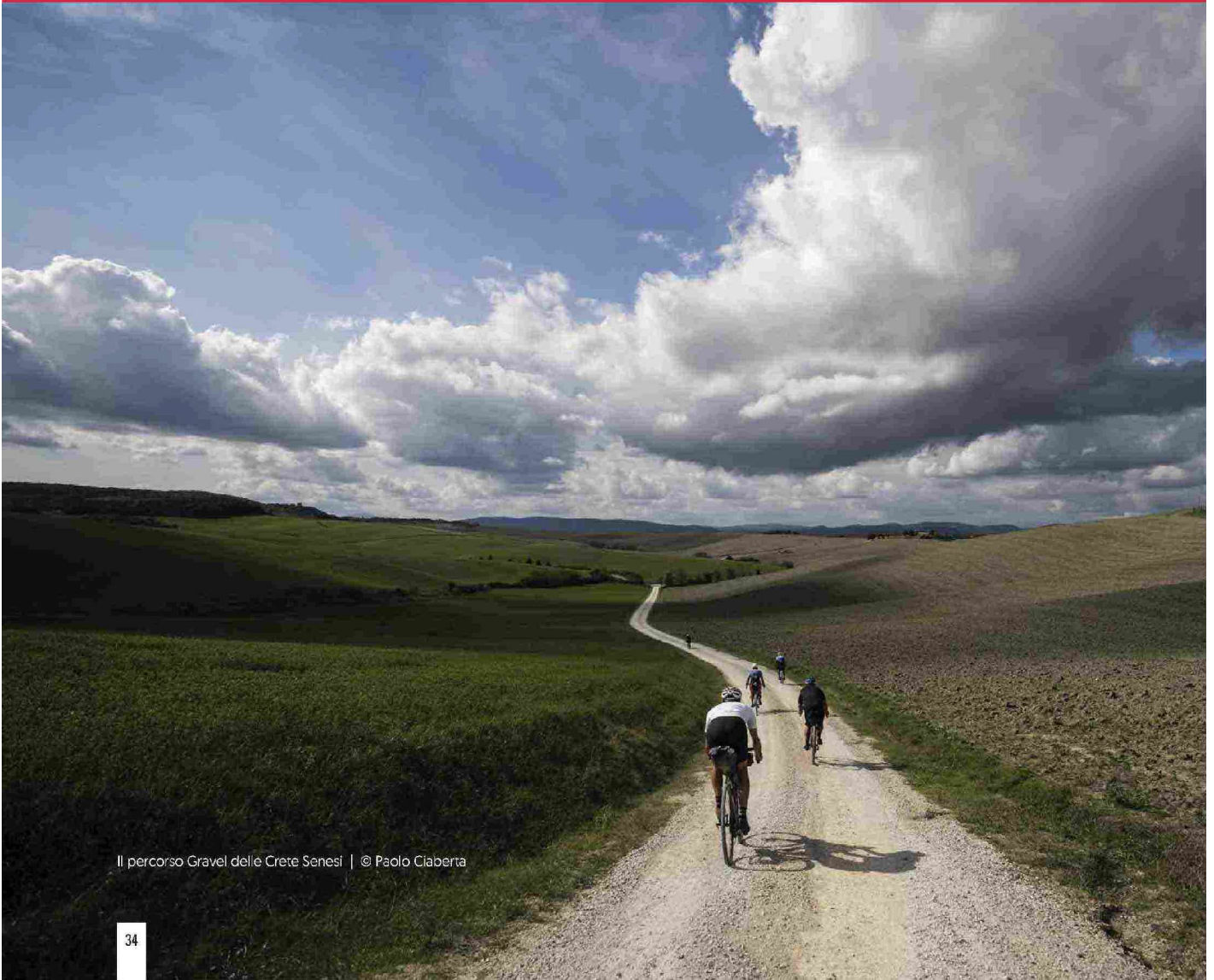
Il percorso Gravel delle Crete Senesi