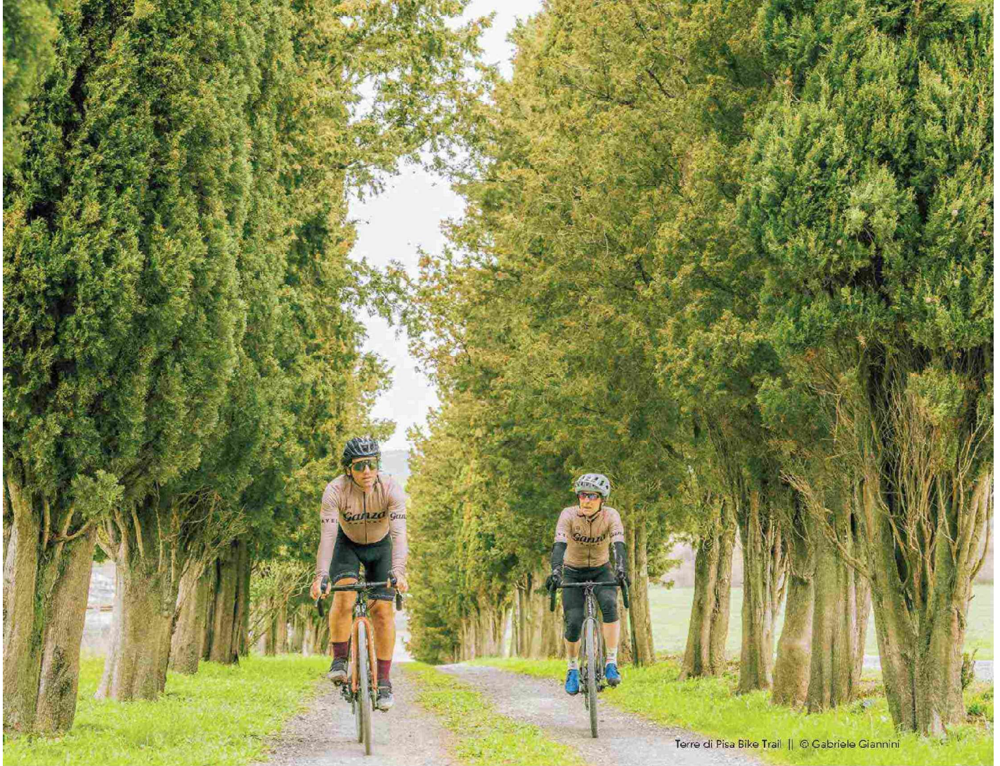
Terre di Pisa Bike Trail