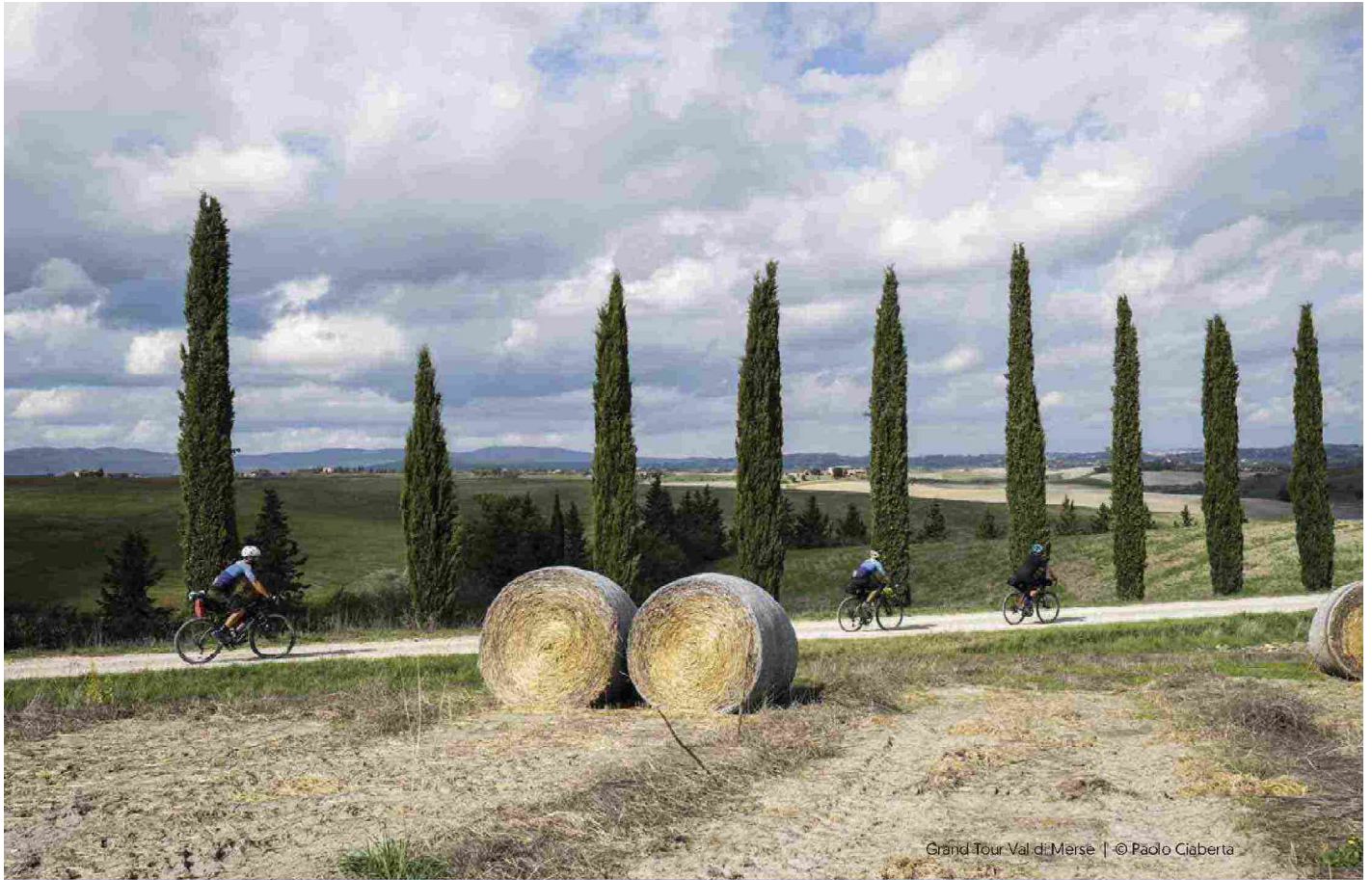
Grand Tour Val di Merse