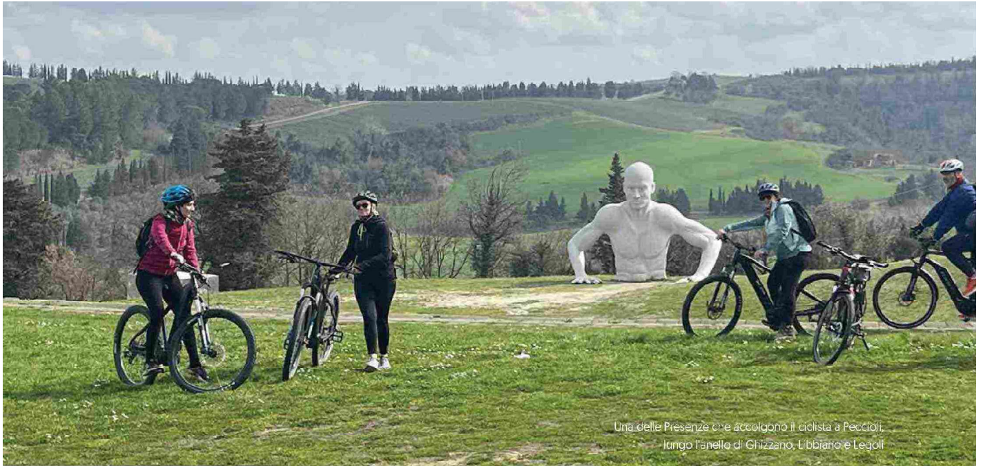
Una delle Presenze che accolgono il ciclista a Peccioli, lungo l'anello di Ghizzano, Libbiano e Legoli