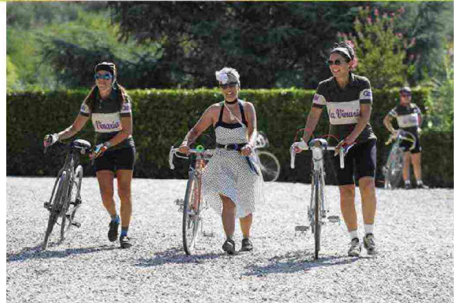
Alcune partecipanti a La Vinaria