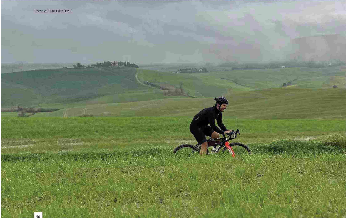
Terre di Pisa Bike Trail